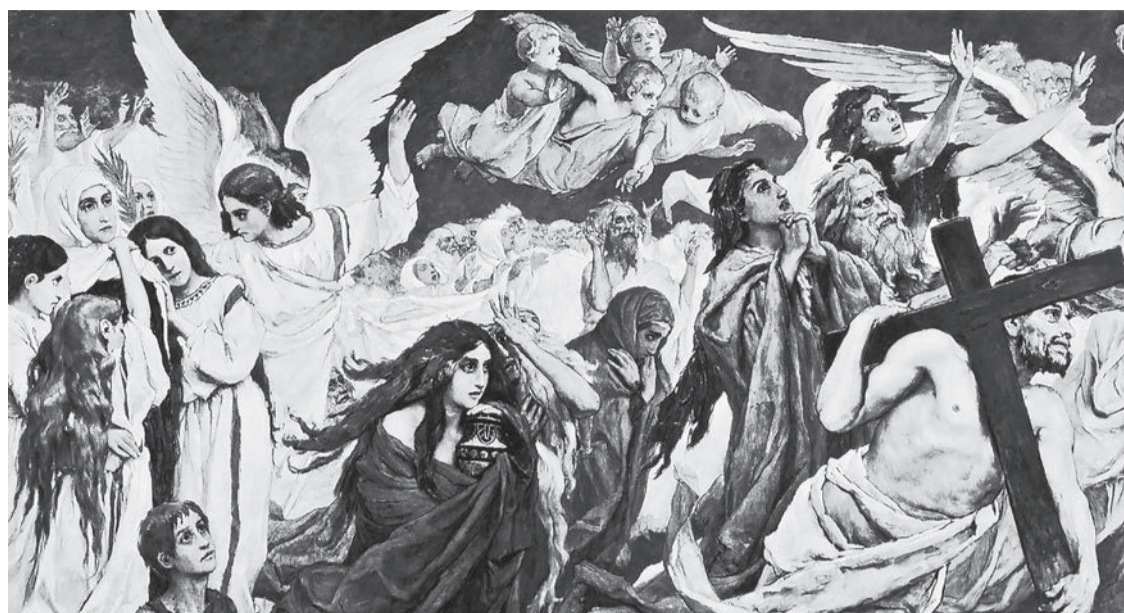
«В ожидании воскресения». Фреска. Богоявленский собор в Елохове.

Мы этого не знаем, Писание не говорит об этом прямо. Но мы можем обоснованно предположить, что, поскольку воскресшие тела не стареют, они не проходят обычного в этом мире развития от младенчества к старости, но пребывают всё время в одном состоянии. Так что, скорее всего, тела не будут младенческими.