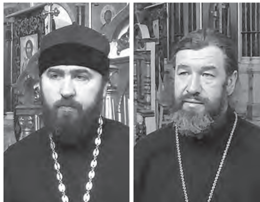
Протоиерей Александр Брижан