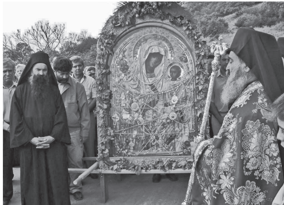
Афонский чудотворный образ «Скоропослушница».