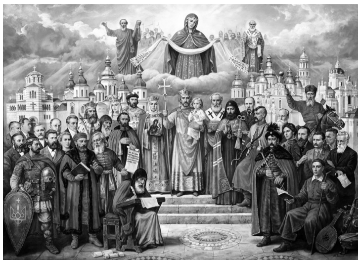
● Икона «Крещение Руси князем Владимиром»

Многие историки считают, что князь Владимир выбрал Православие из нескольких религий. Он создал в Киев представителей разных вероучений, каждый описал достоинства