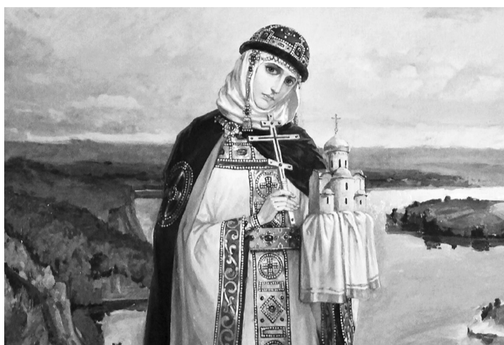
«Святая равноапостольная княгиня Ольга». Художник Михаил Нестеров

Крестившись, Ольга велела строить по погостам хра-