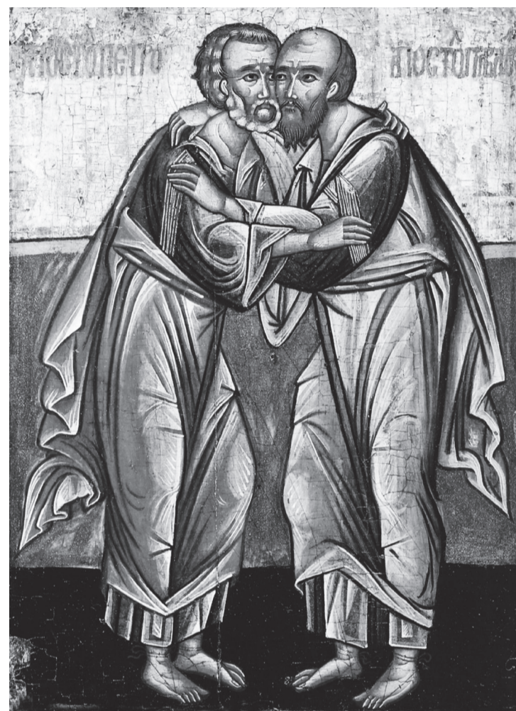
Святини апостоли Петре и Павле, молитве Бога о нас!

В Иерусалиме он присоединился к христианской общине, познакомился с апостолами. Во время первого путешествия по Кипру (45—51 годы) его стали