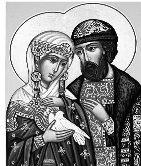
Святые княже Петре и Февроние, молитесь Бога о нас!

Супругам рекомендуется воздержаться от интимных отношений и зачатия ребёнка. Нельзя допускать плохих мыслей, ругаться матом, ссориться с людьми, завидовать и осуждать.