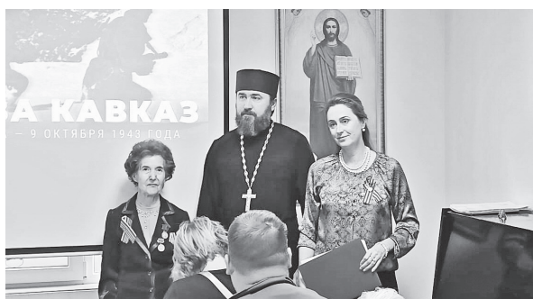
«А КАВКАЗ» 9 ОКТЯБРЯ 1943 ГОДА

Во второй части встречи гостям представили слайд-презентацию о жизни и служении святого апостола и евангелиста, ознакомили с фрагментами текстов Евангелия от Иоанна и Апокалипсиса, показали фильм «Апокалипсис. Откровения Иоанна Богослова» и короткометражные фильмы, снятые в рамках молодёжного патриотического проекта «Потомки Победителей».